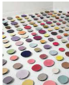
いまふくふみよ《帰降する時間》