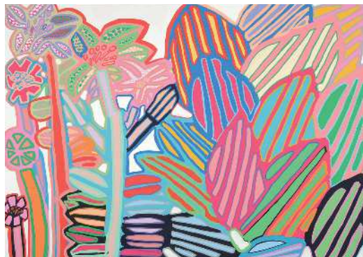
山野将志《水玉もよう南国のほっば》