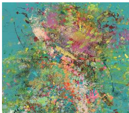
小原和真《音の足跡50000色》