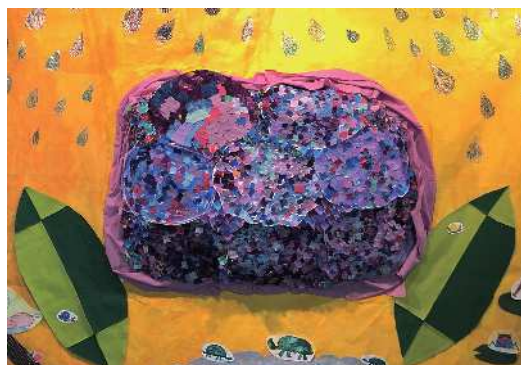
あいほうふく吹田《あじさい》