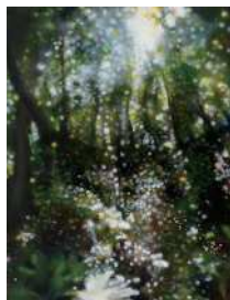
山本修司《谷に降る陽》