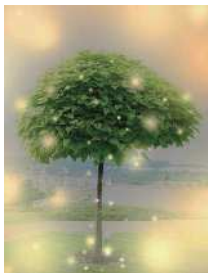
赤崎みま《ひかりの風景一木》